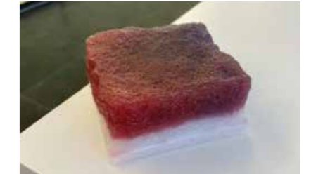
Projekt: LED Pflasterstein

Nutzen: Sehr hohe Transparenz durch hohe Transmissionswerte