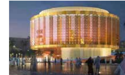
Projekt: Flexibler LED Vorhang für die EXPO 2020

Nutzen: Material auch in Kartuschen verfügbar