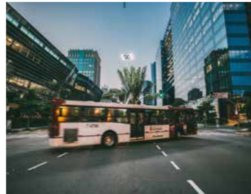
Transport & Beförderung