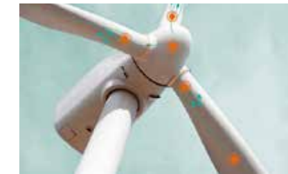
Projekt: Sensor einkleben in Windblatt

Nutzen: 30 % schnellere Aushärtung und somit schnellere Oberflächen- trockenheit – wichtig für Nach- bearbeitung (Schleifen)