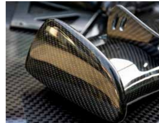
Faserverbund mit Faserverbund