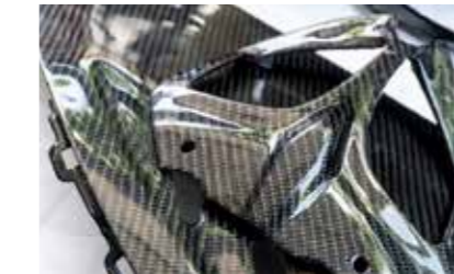
Projekt: Kunststoffhalter (ABS-CFK)