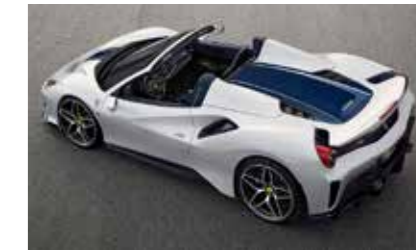
Projekt: Sichtbauteil Sportwagen (CFK-CFK)

Nutzen: Lange offene Verarbeitungs- zeit für korrekte Ausrichtung (Schaft – Schlägerkopf)