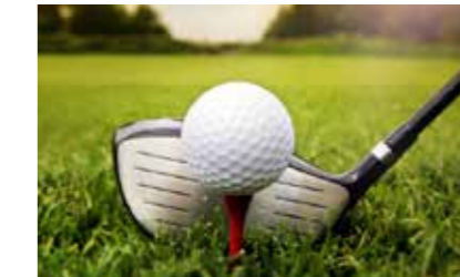
Projekt: Golfschläger (verchromter Stahl-CFK)

Nutzen: Fixierzeit-Einsparung von über 20 % durch sehr schnellen Kraftaufbau des Klebstoffs