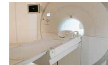
Projekt: Halterung an medizinischem Gerät

Nutzen: Unsichtbare Klebefuge (kein BLRT), keine Nachbearbeitung erforderlich