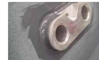
Projekt: Kabeldurchführung (GFK-Metall)

Nutzen: Inline-Qualitätskontrolle: Farbwechsel des Klebstoffs signalisiert die Anfangsfestigkeit